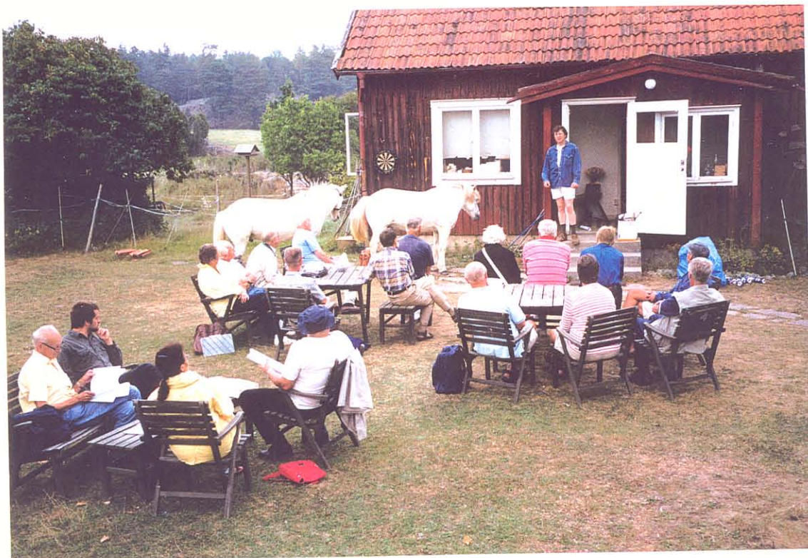
Idyll på Ringsö med Kustlaget