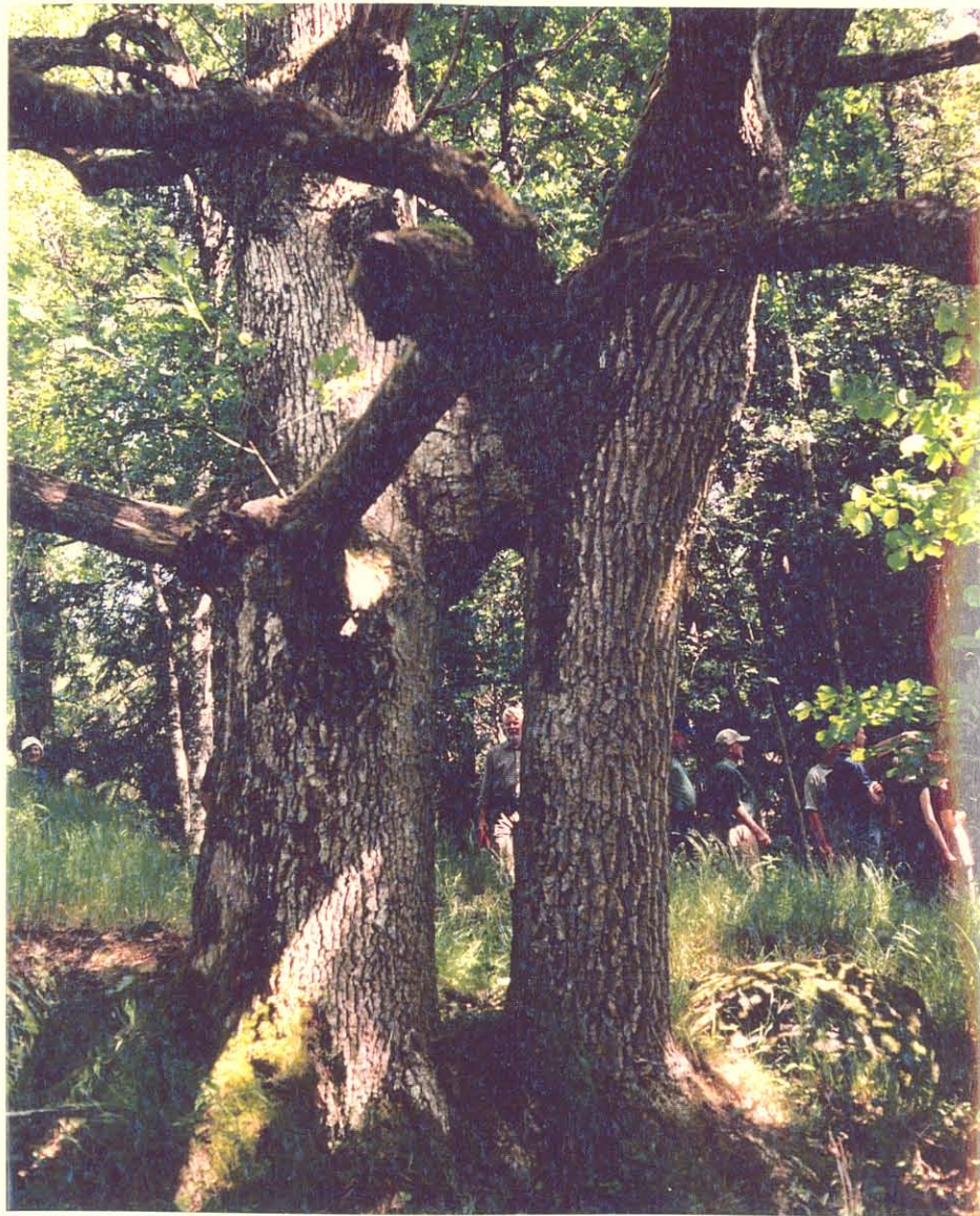
Stadigt sällskap på Fifång

Hölo Mörkö Hembygdsförening, Kyrkskolan, 153 92 HÖLÖ. Tel. 08-551 571 60 (telesvar) Pg. 82 65 18-3