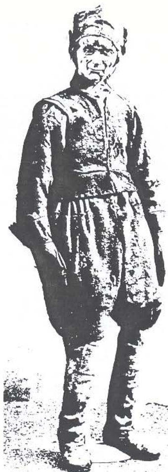
Sjöman i "båtsmanskläder", mössa, kråghandskar, strumpor och skor. Klädelsen sammansatt av delar från sex olika Wasafynd.